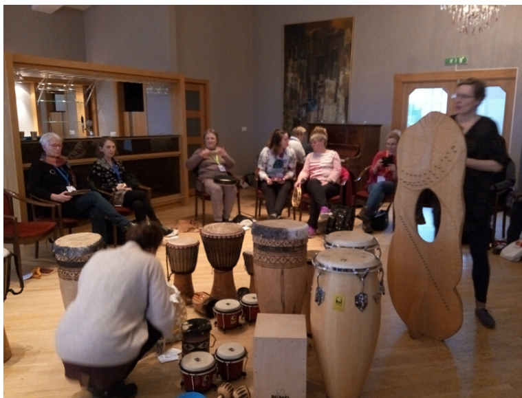
Töötuba Euroopa kunstiteraapiate konverentsil Islandil.