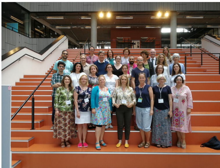
EMTC delegaadid Aalborgis.

kõik projektis osalenud maade esindajad ning kohalikud muusikaterapeutid ja üliõpilased. Jagati kogemusi, külastati üht väga huvitavat kohalikku kooli (kus on aastaid rakendatud muusika jt. kunstiteraapiate tehnikaid igapäevases õppetöös), kuulati osalejate nii teaduslikke uurimus- kui muusikalisi ettekandeid, musitseeriti-improviseeriti koos.