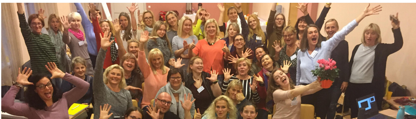
2nd Baltic Music Therapy Camp osalejad ja koolitaja.