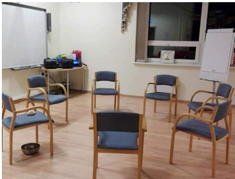
Kovisioonigrupi kohtumispaik Tallinnas Kõo Keskuses.